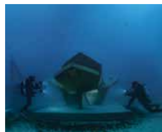
Récifs artificiels pour réhabiliter les fonctionnalités écologiques d'un écosystème dégradé