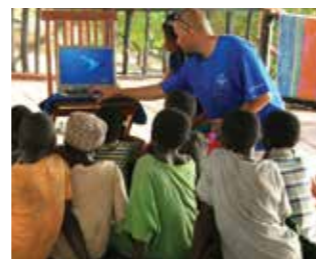
Sensibilisation des enfants sur nos relations à l'environnement marin et aux questions de pollution, surpêche et développement durable, 2010, Pemba, Tanzanie