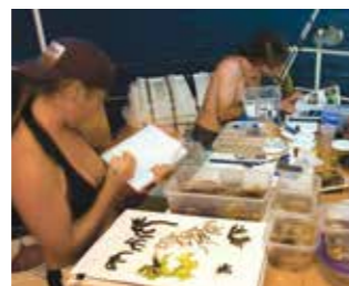
Collecte d'échantillons et de données pour établir l'état des lieux de la biodiversité d'un récif de corail, Kiritimati Island, Pacifique 2005