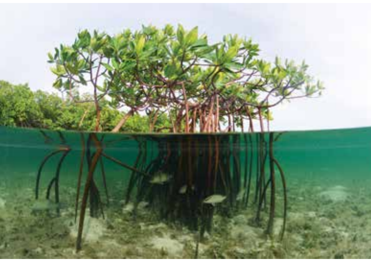
Mangrove Bahamas

..... Les écosystèmes marins sont des viviers de la biodiversité et les garants des ressources du futur. Il y a un véritable enjeu dans la protection de ces écosystèmes fragiles.