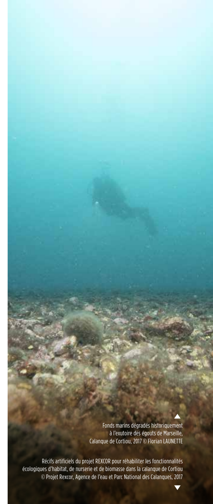
Fonds marins dégradés historiquement à l'exutoire des égouts de Marseille, Calanque de Cortiou, 2017

Océan Atlantique, Océan Pacifique, Océan Indien, Bassin Méditerranéen et Zones Polaires.