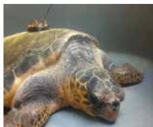
Lâcher de tortue soignée, équipée de balise pour suivre ses déplacements