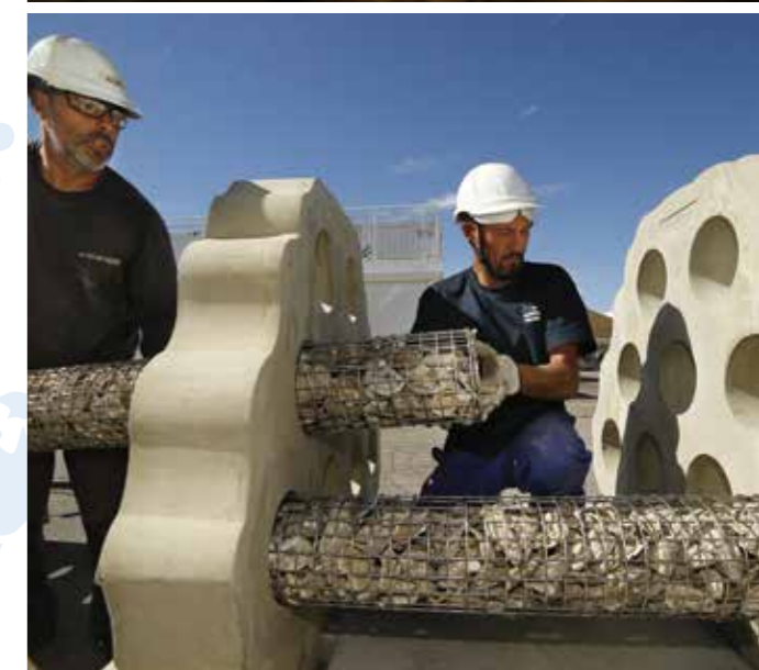
Récifs artificiels du projet REXCOR pour réhabiliter les fonctionnalités écologiques d'habitat, de nurserie et de biomasse dans la calanque de Cortiou